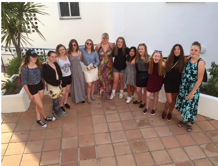
Ungdomskoret Amazing i Spania 2015