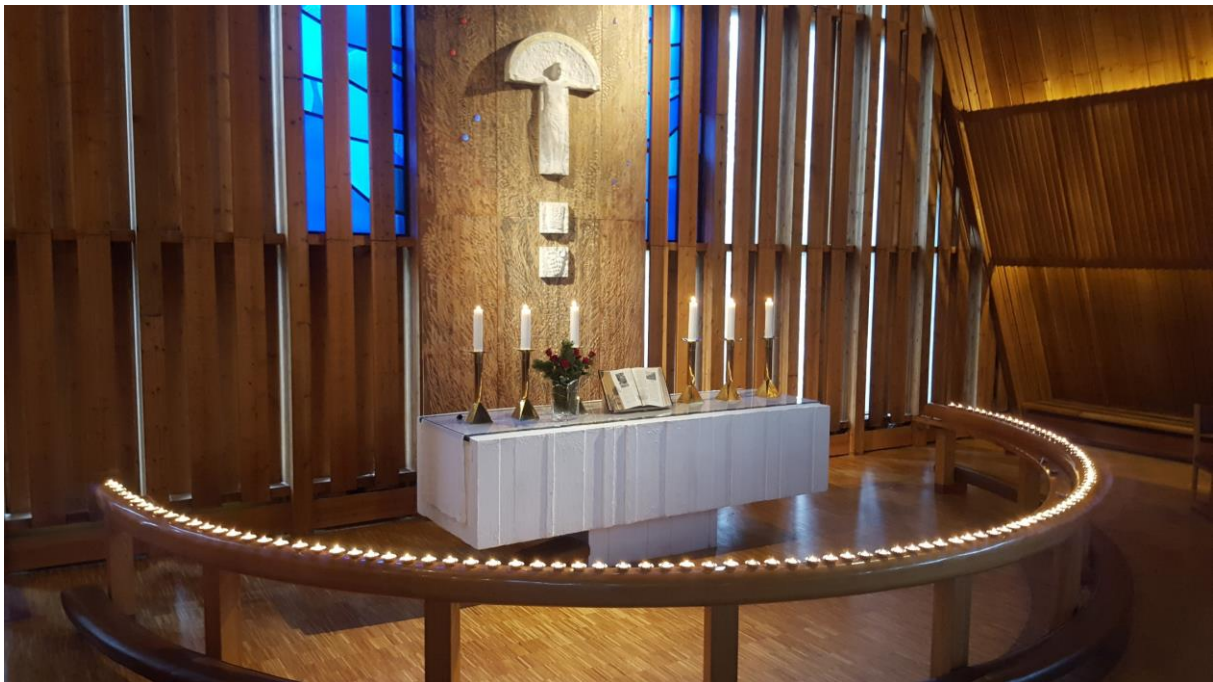
Allehelgen 2022 Brumunddal Kirke